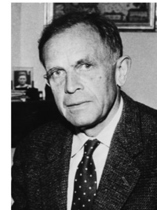
Wilhelm Röpke (1899 bis 1966)