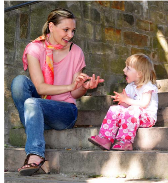
Freizeit: sinnvoll gestalten