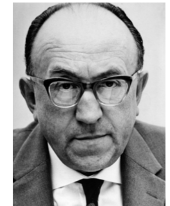
Alfred Müller-Armack (1901 bis 1978)

Staat, alle sozialen Integrationsformen überhaupt bis hinauf zur Menschheit insgesamt, ferner das Religiöse, das Ethische, das Ästhetische, kurz gesagt das Menschliche, das Kulturelle überhaupt“ (Rüstow 1960). Heute sieht der Forschungsbereich der Positiven Psychologie ähnliche Aspekte im Mittelpunkt eines glücklichen Lebens.