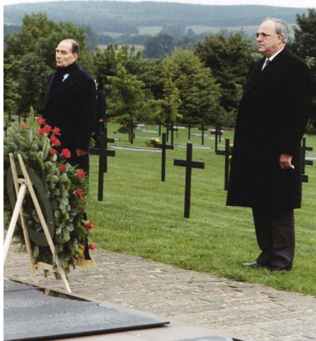
Frieden: Dt.-frz. Versöhnung 1984, Soldatenfriedhof Douaumont