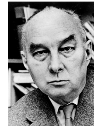
Alexander Rüstow (1885 bis 1963)