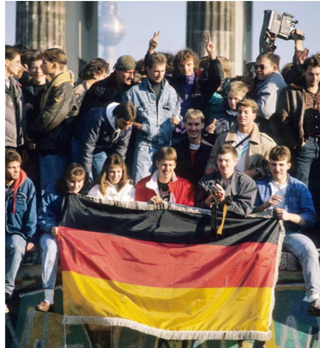
Freiheit: Grenzöffnung 11.11.1989, Brandenburger Tor, Berlin