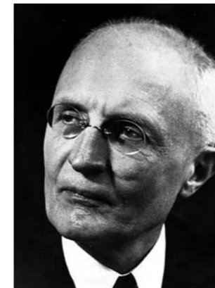
Walter Eucken (1891 bis 1950)

Noch einen Schritt weiter ging der Wirtschaftswissenschaftler und Soziologe Alexander Rüstow (1885-1963), indem er die „Vitalsituation“ des Menschen in den Mittelpunkt stellte, also sein allgemeines Lebensgefühl und seine Zufriedenheit. „Dieses Sichfühlen des Menschen in seiner Lebenslage hängt zwar als Grundlage ebenfalls von ökonomischen Dingen ab, aber in weit höherem Maße von überökonomischen Dingen“ (Rüstow 1960). Wichtig sind aus seiner Perspektive „Familie, Gemeinde,